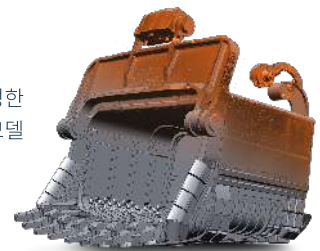
Geomagic Design X에서 생성한 파라메트릭 솔리드 모델

CAD 사용자라면 Geomagic Design X도 바로 사용할 수 있습니다. 사용자 인터페이스와 워크플로 도구를 완전히 새롭게 개선하여 3D CAD 및 모델 데이터를 최종 설계와 빌드에 따라 신속하고 정확하게 생성하는 작업이 이전보다 훨씬 쉬워졌습니다.